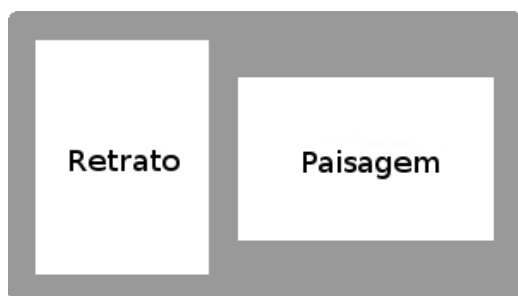
Forma correta de digitalização dos documentos

11.5.1. O candidato deverá digitalizar os documentos no formato RETRATO (vertical) ou PAISAGEM (horizontal), com as informações disponíveis para os avaliadores sem necessidade do uso do recurso de “girar visualização”, conforme imagens a seguir: